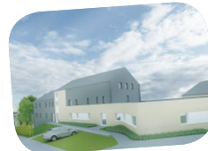
13a, rue du Nord L-8806 Rambrouch