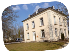
68, route d'Arton L-8310 Capellen

Die Dienstleistungen werden hauptsächlich in den Räumlichkeiten der FAL in Capellen angeboten.