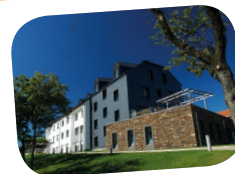
31, Duerefstrooss L-9766 Munshausen