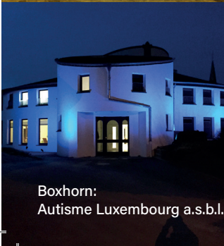
Boxhorn: Autisme Luxembourg a.s.b.l.