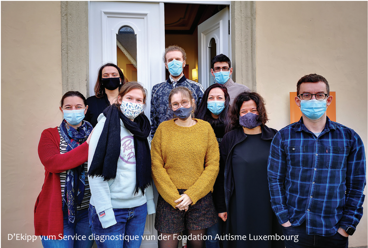
D'Ekipp vum Service diagnostique vun der Fondation Autisme Luxembourg

sech an der Gesellschaft ze behuelen huet. Wougéint all aner Leit dës Reegelen einfach ganz selbstverständlech unhuelen an och ausféieren, kann ech se net novollzéien. Ech verstinn net, wouhier een dës Reegele kennt, a wéi een sech un déi Reegelen adaptéiere soll, wann se mol néierens kloer opgeschriwwe sinn. Fir mech missten déi Reegele genau sou am Gesetz festgehale ginn, wéi all aner Gesetz och. Da kéint ech se och esou léieren.