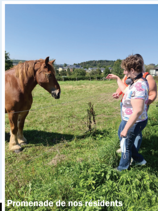
Promenade de nos résidents