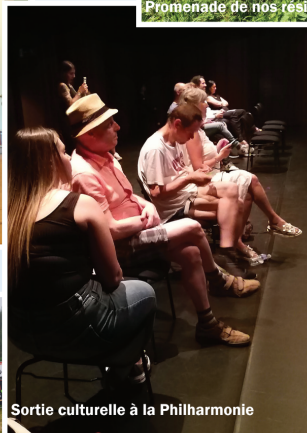
Sortie culturelle à la Philharmonie